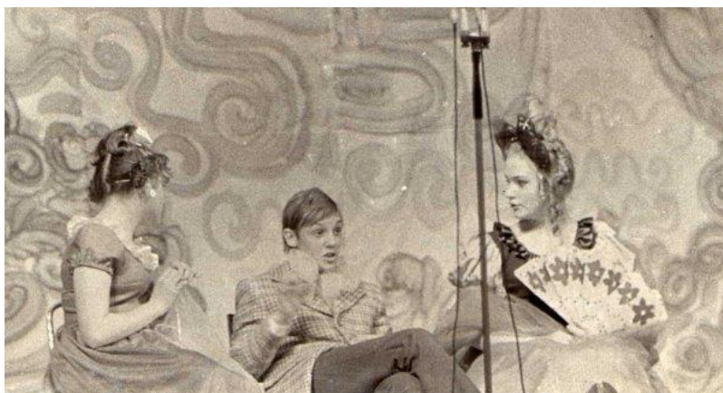
Сцена из «Ревизора».

Вместе с участниками студии «взрослел» и репертуар, появилась классика: «Ревизор», «Борис Годунов» (сцены), «Беда от нежного сердца» и другие.