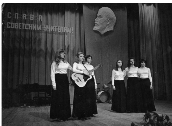
Сцена из «Зримой песни»