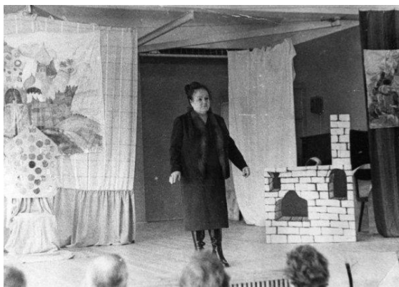
Тармира Ивановна на сцене среди декораций к спектаклю «По щучьему велению»

Вместе с участниками студии «взрослел» и репертуар, появилась классика: «Ревизор», «Борис Годунов» (сцены), «Беда от нежного сердца» и другие.