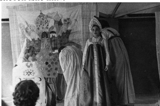
Сцена из сказки «По щучьему велению»

Первыми артистами стали ученики 5-6 классов, а репертуар – сказки «Золушка», «По щучьему велению», «Золотой ключик».